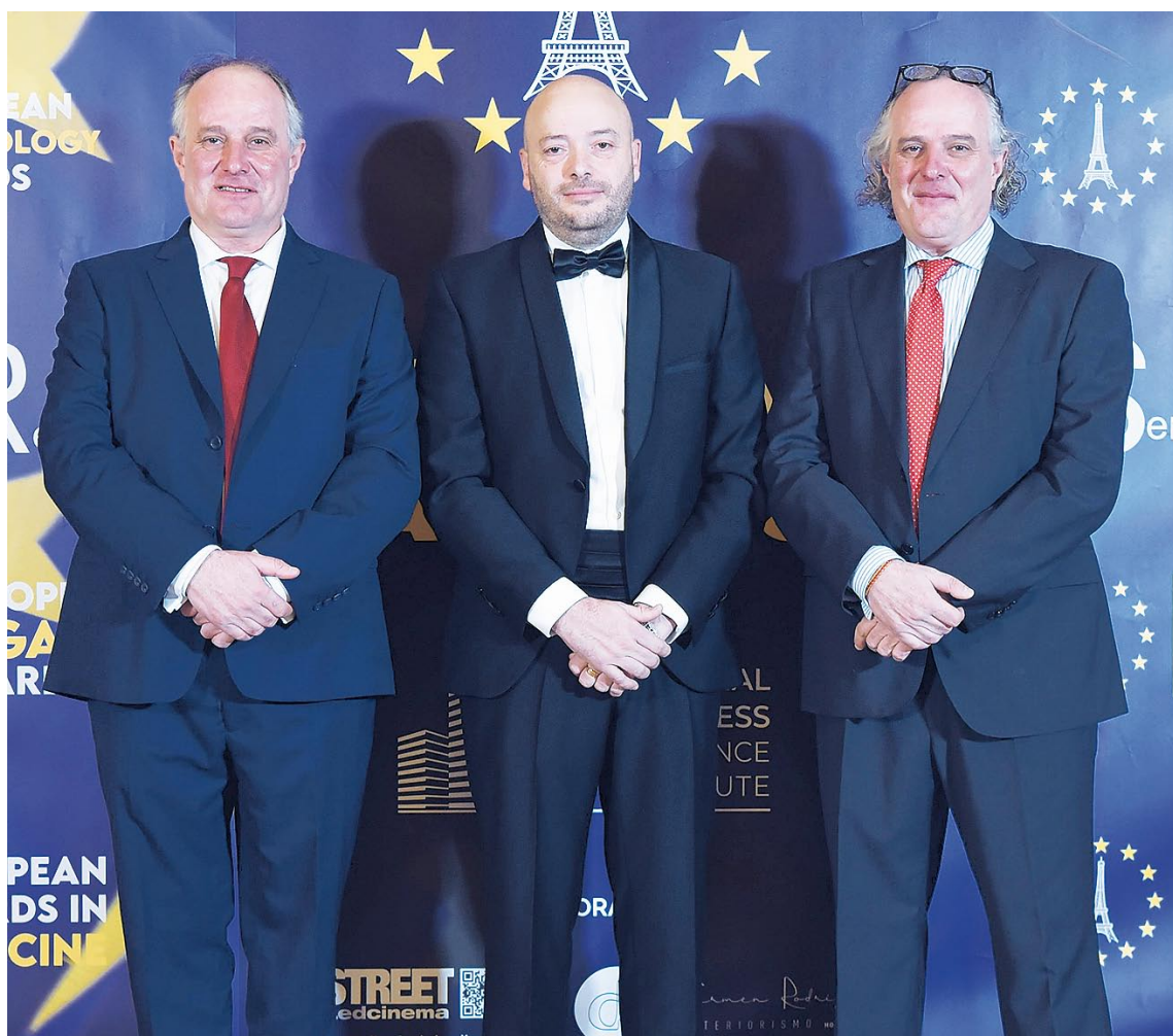
Los representantes de la firma, en el photocall previo a la gala