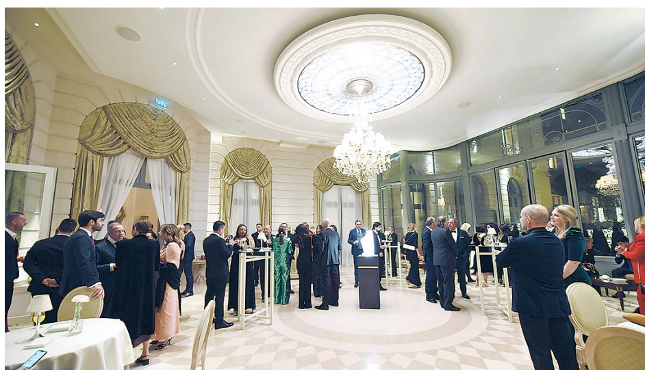
Los asistentes pudieron disfrutar de un cóctel de bienvenida