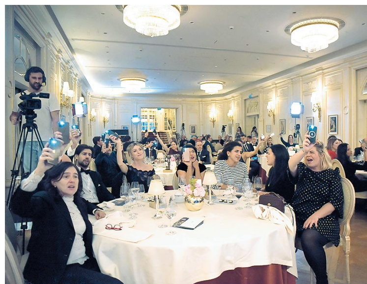
El buen ambiente reinó durante toda la gala