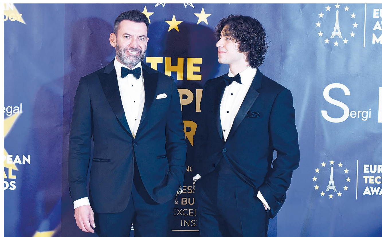
El galardonado posa en el photocall momentos antes del comienzo de la gala

Su extraordinario índice de éxitos habla por sí mismo. Ha demostrado repetidamente su capacidad para abordar casos complejos y difíciles, y su enfoque estratégico