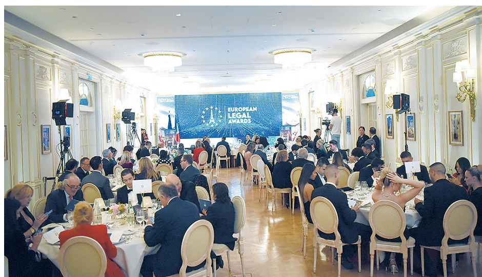
El salón Vendôme del hotel Ritz acogió el evento