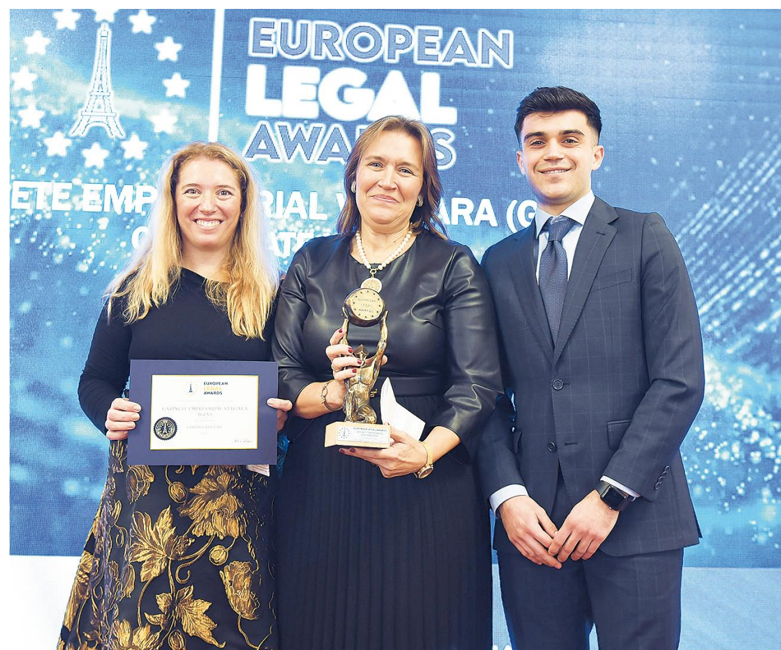
Los representantes del bufete posan tras recibir el galardón