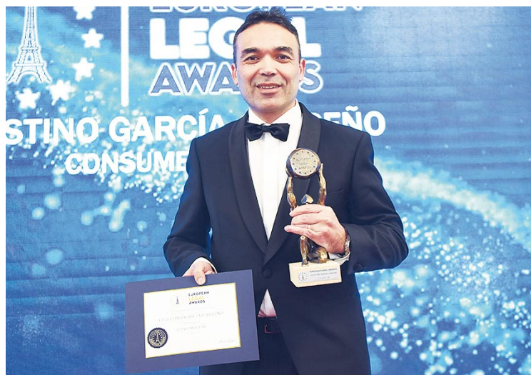
El galardonado posa con el diploma y la estatuilla

Desde ese momento, esta sentencia se invoca a diario en los juzgados de toda España y ha supuesto una gran victoria para el consumidor. Con ella, el alto tribunal estableció una jurisprudencia de gran trascendencia para el presente y el futuro de las revolving y del sistema bancario que está permitiendo dar pasos de enorme relevancia: millares de contratos anulados no solo por usura sino también por falta de transparencia, ingentes cantidades de dinero restituidas a